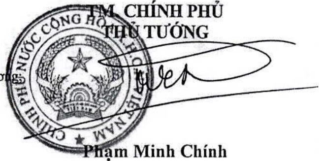
Phạm Minh Chính